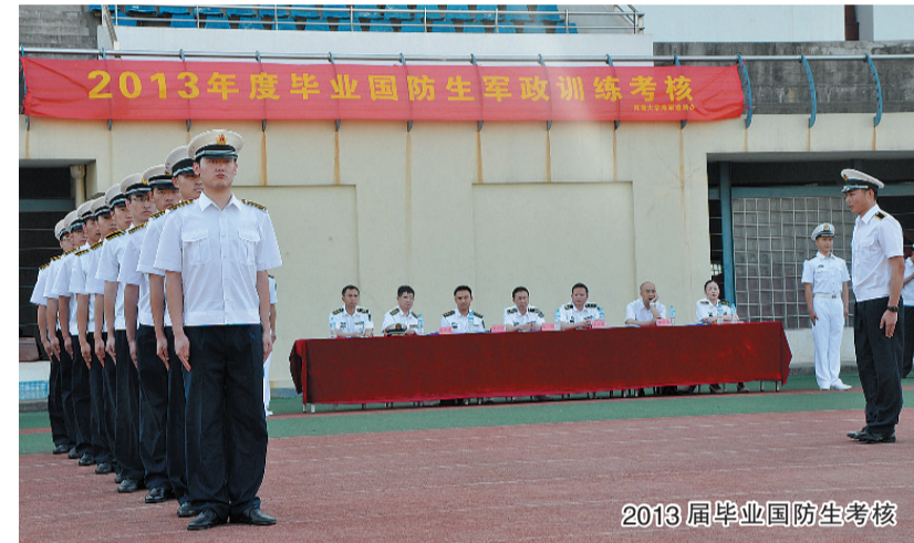
2013届毕业国防生考核

到的问题进行探讨和交流,吸收好的经验做法,开阔视野,拓展思路。定期进行有关政策文件的学习,增强执行政策规定的自觉性和原则性。